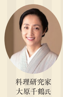
料理研究家 大原千鶴氏